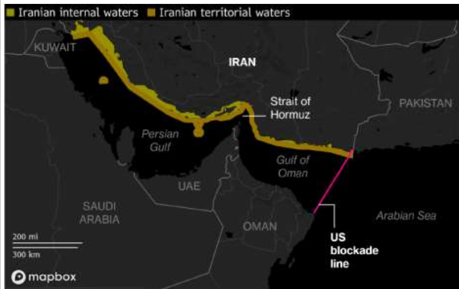
Fig 1: US blockage keeps pressuring Strait of Hormuz