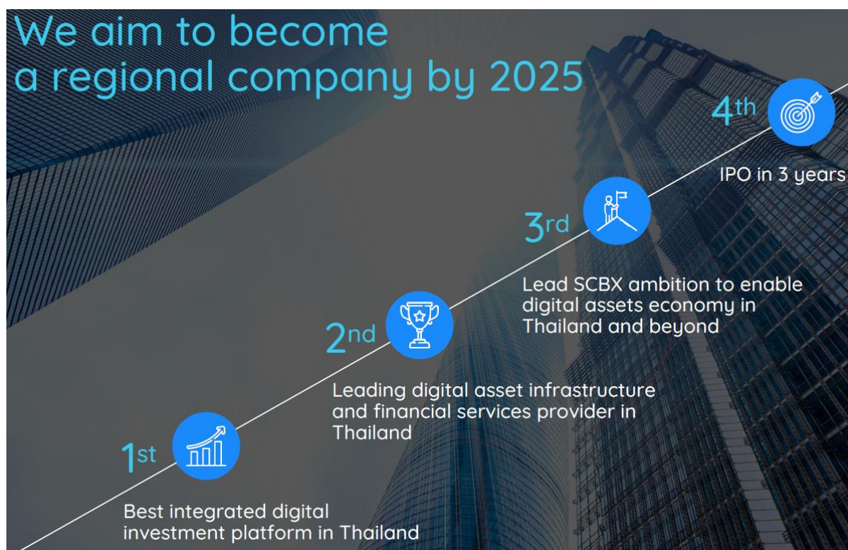
Fig 2: InnovestX – prepare to IPO in 2025E