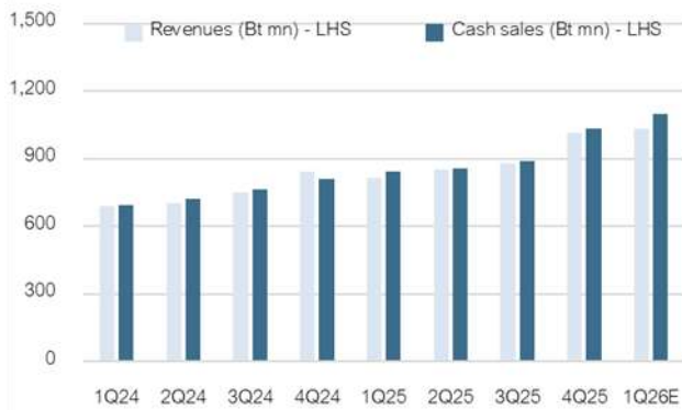
Fig 2: Revenues vs Cash sales