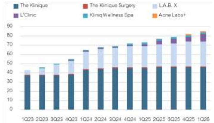
Fig 3: No. of branches