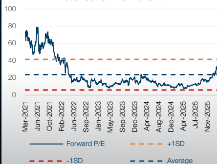
Historical 5Y Forward P/E