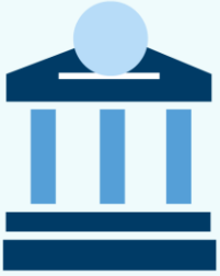
ฝากเงินจากบัญชีธนาคาร (ATS)

ท่านสามารถส่งคำสั่งฝากเงินเข้าบัญชีลงทุน (ALGO) โดยหักเงินจากบัญชีธนาคารที่ได้สมัครบริการหักบัญชีอัตโนมัติ (ATS) ได้ สามารถส่งคำสั่งได้ทุกวัน 24 ชั่วโมง ทำรายการฝากขั้นต่ำ 100 บาท