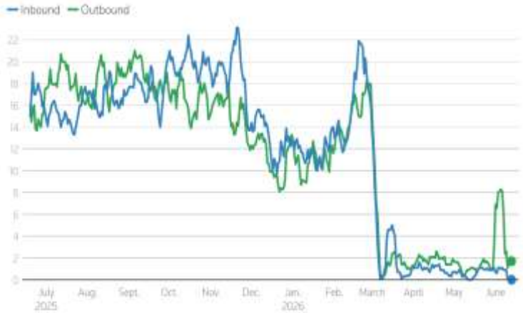
Fig 2: Oil-tanker transits through the Strait of Hormuz