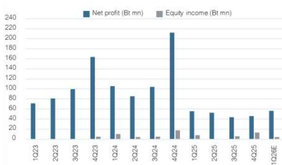
Fig 2: Net profit vs Equity income