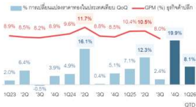
Fig 1: % เปลี่ยนแปลงราคาทองในประเทศ &amp; GPM ธุรกิจค้าปลีกทอง

Analyst: Amnart Ngosawang (Reg. No. 029734)