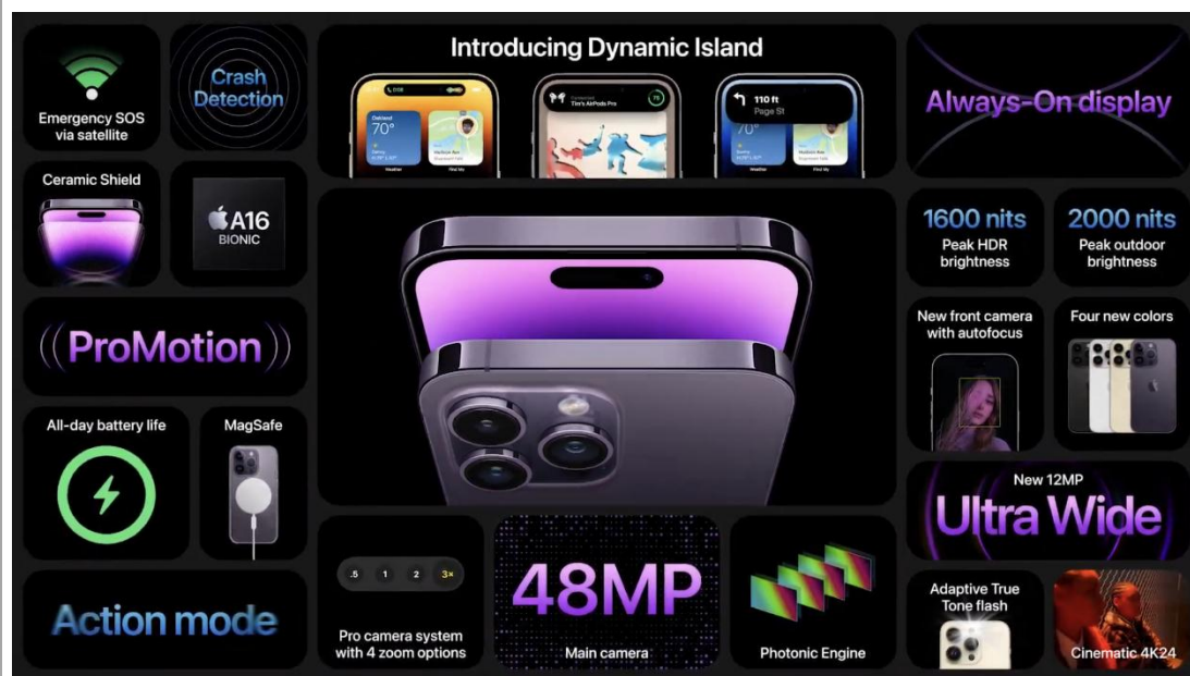
Fig 2: iPhone 14 Pro, iPhone 14 Pro Max specification