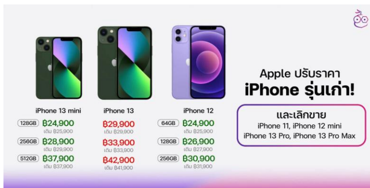
Fig 4: iPhone 12 and 13 price reducing