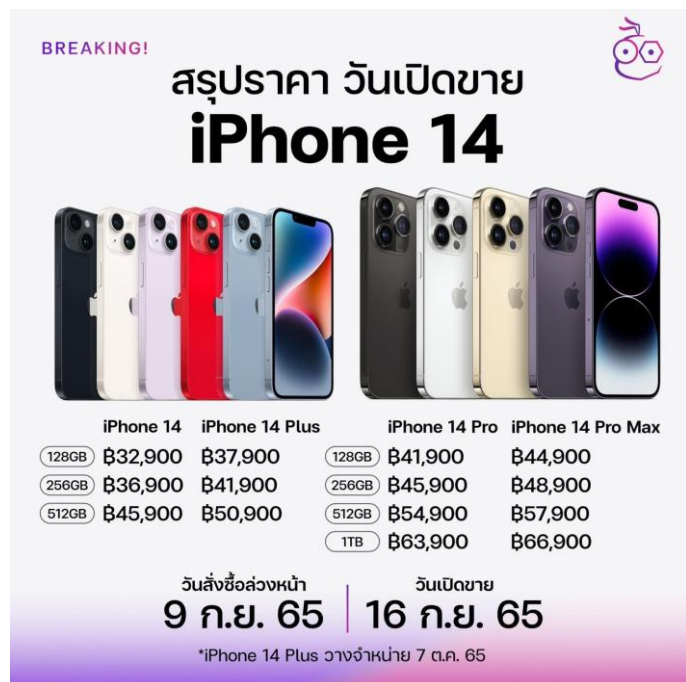
Fig 3: iPhone 14 Pricing