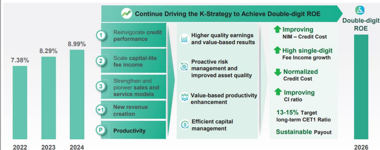
Fig 2: Clear pathway to achieve double-digit ROE by 2026E