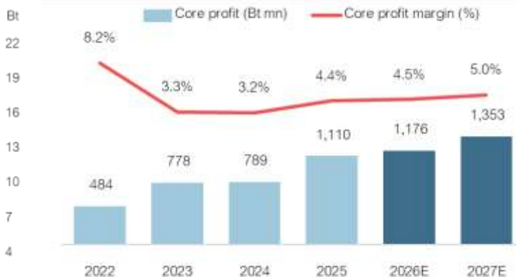
Fig 3: Core profit (Bt mn) vs. core profit margin (%)