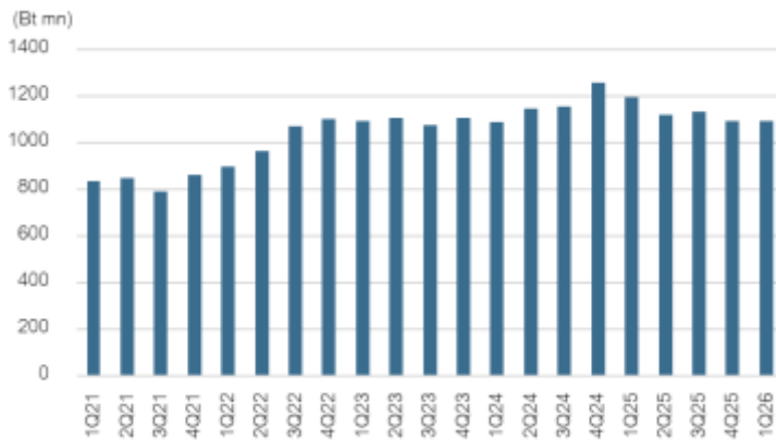
Fig 2: Domestic sales