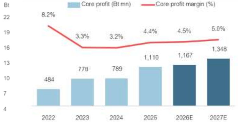
Fig 2: Core profit (Bt mn) vs. core profit margin (%)