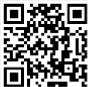
คู่มือการใช้งานระบบ Inventech Connect