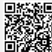
วิดีโอการใช้งานระบบ Inventech Connect

*หมายเหตุ การทำงานของระบบประชุมผ่านสื่ออิเล็กทรอนิกส์ และระบบ Inventech Connect ขึ้นอยู่กับระบบอินเทอร์เน็ตที่รองรับของผู้ถือหุ้นกู้หรือผู้รับมอบฉันทะ รวมถึงอุปกรณ์ และ/หรือ โปรแกรมของอุปกรณ์ กรุณาใช้อุปกรณ์ และ/หรือโปรแกรมดังต่อไปนี้ในการใช้งานระบบ