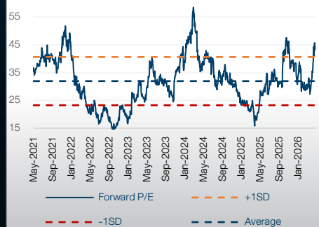
Historical 5Y Forward P/E