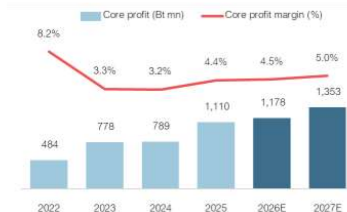
Fig 3: Core profit (Bt mn) vs. core profit margin (%)