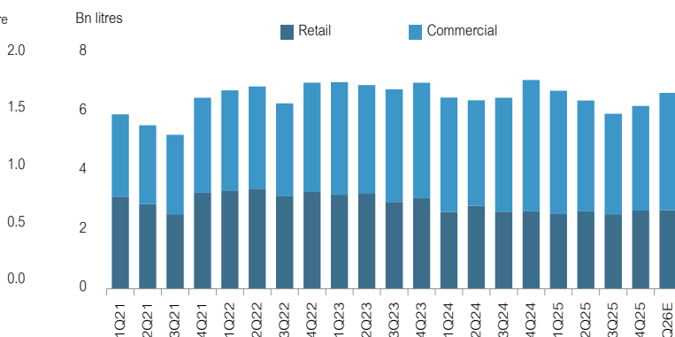
Fig 3: Quarterly domestic oil sales volume forecast